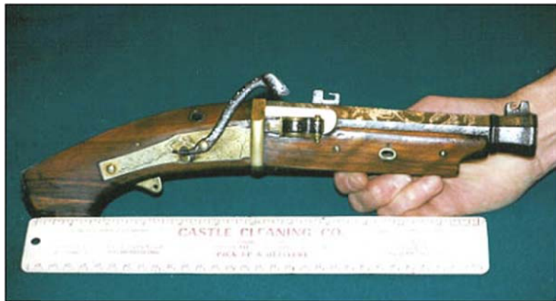
Lauflänge 165 mm Kaliber 15 mm Hahn mit Spiralfeder (Schlosstyp 4)

Pistole mit innenliegender Spiralfeder und eisernem Hahn. Schäftung aus Nussbaum (Das ist eine grosse Ausnahme. Normalerweise sind Japanische Lunten in Weisseiche geschäftet.)